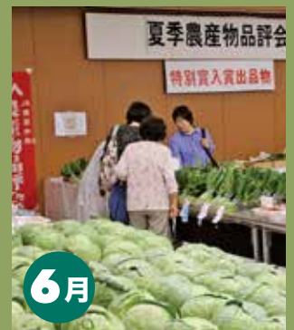
城西地区・杉並中野地区 夏季農産物品評会