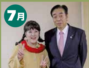
杉並中野支店新築オープン